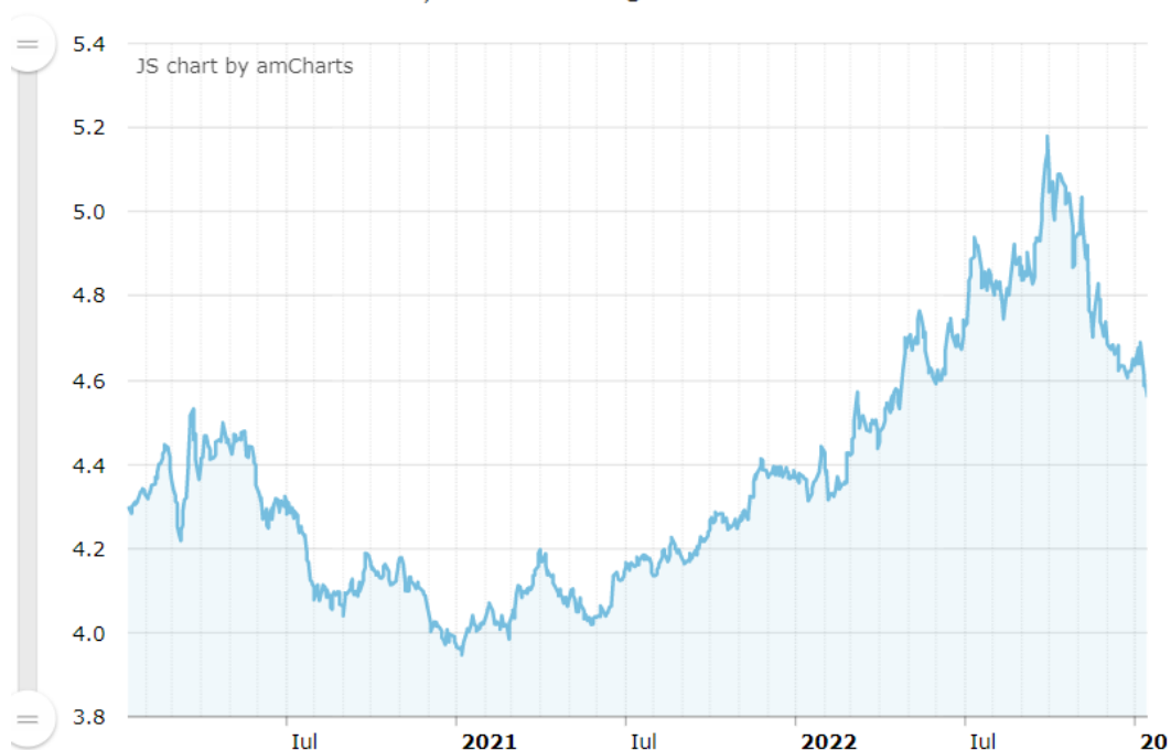
Evoluție curs valutar - grafic interactiv