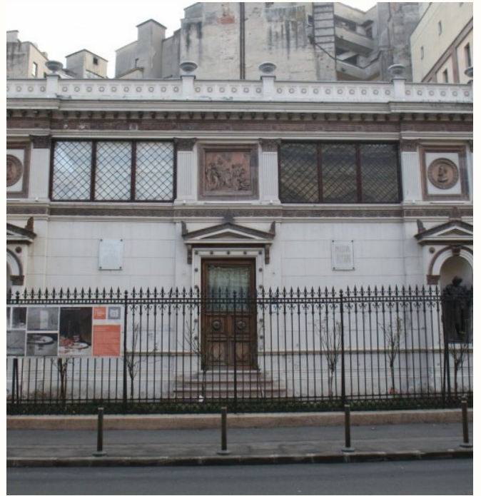
Muzeul Aman – un templu plin de simboluri, casă proiectată și construită de T. Aman. El a proiectat și sceptrul și coroana de oțel a regelui Carol I.

Conceptul se adresează managerilor din București, având scopul de a-i ajuta să cunoască istoria adevărată a orașului din ultimii 200 de ani și de a-i face, astfel, să se bucure de faptul că trăiesc într-o capitală cu identitate și personalitate demne de un oraș mare. Vom vedea cum trăiau și gândeau cei ale căror idei au dus la construcția orașului și a țării, având în minte apartenența la Europa.