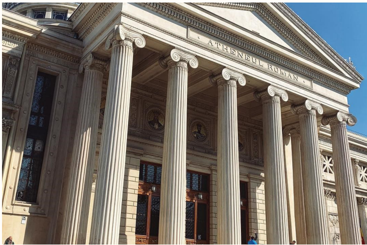
Ateneul Român - templu grecesc sau roman?