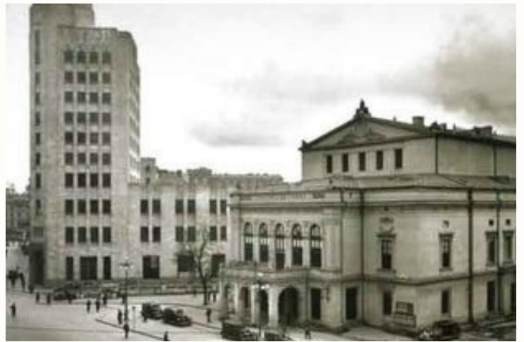
Palatul Telefoanelor, 52 m înălțime, clădire Art Deco construită în stil zgârie-nori american pe structură metalică /Reșița, pe locul terasei Oteteleşanu.