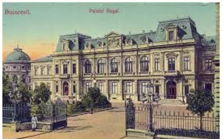
Vechiul Palat Regal, care încorporează și casele boierilor Golești.