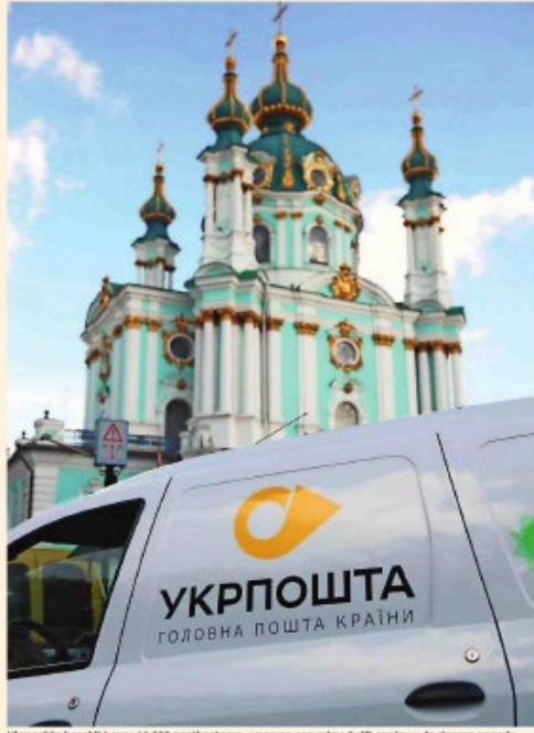
Ukrposhta beschikt over 11.000 postkantoren, waarvan een ruime helft opnieuw de deuren opende.

Lehane in bezetto of bedogende steden als Loehansk en Mariopol blijft Ukrposhta volgen de voorzitter actief op het veld. Het bedrijf heeft de Oekraïense bevolking zich postwagens aan de grenzen. De