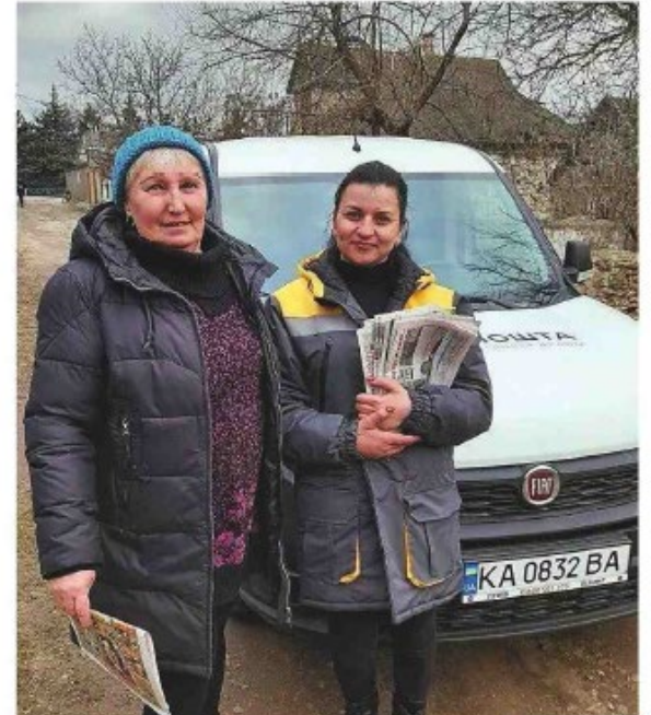
Naast de krant draagt de postbode in Oekraïne deze dagen ook voedsel, medicijnen en andere levensnoodzakelijke middelen rond.